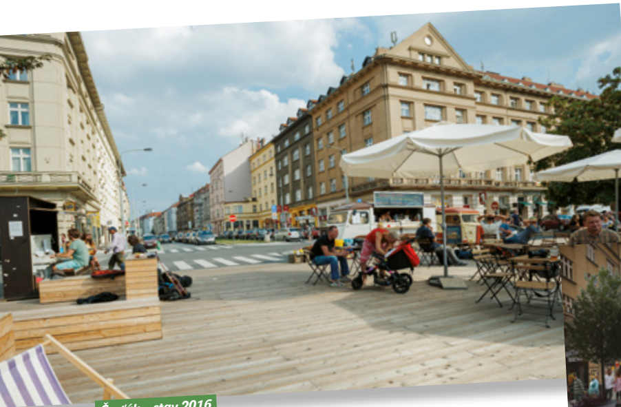
Šesták – stav 2016