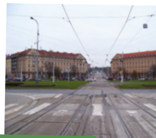
Vítězné náměstí dnes