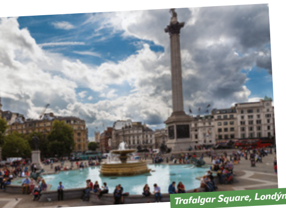
Trafalgar Square, Londýn